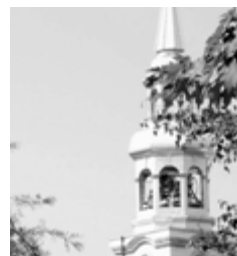
Les clochers de Montréal