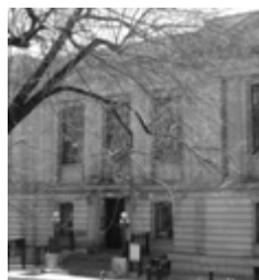
Les bibliothèques Saint-Sulpice et de Montréal