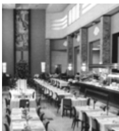
Le 9 e étage chez Eaton

Le 26 avril 2005, Héritage Montréal dévoilait une liste de dix sites qui sont menacés. Si cette liste n'est pas exhaustive, les sites présentés sont cependant emblématiques des enjeux auxquels fait face le patrimoine urbain.