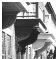
Les escaliers, les balcons et les corniches