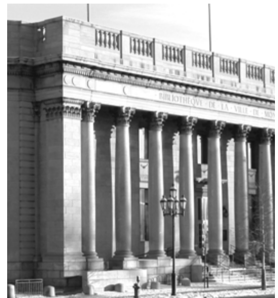
Première bibliothèque francophone publique et gratuite à Montréal, la Bibliothèque Centrale se cherche une nouvelle vocation.