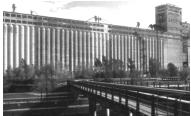
Six propositions sont actuellement étudiées par le Port de Montréal pour la reconversion du silo numéro 5.

C'est donc dire que la protection et la mise en valeur du patrimoine montréalais sont des sujet d'actualité. Montréal possède un patrimoine d'une richesse et d'une diversité exceptionnelles, qui contribue remarquablement à la personnalité de nos quartiers. Alors que d'importants projets publics sont annoncés (tels le centre hospitalier universitaire sur le mont Royal ou le réaménagement du secteur du Havre), on est pleinement en droit d'attendre de l'actuelle course électorale qu'elle aborde les questions de patrimoine ou d'aménagement de façon substantielle et intelligente.