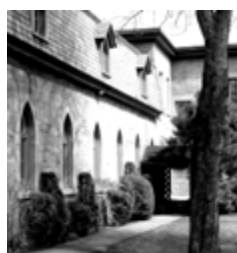
Le couvent des Carmélites