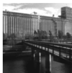
Le Silo n° 5