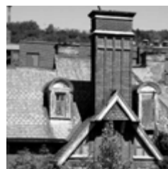
La maison Redpath