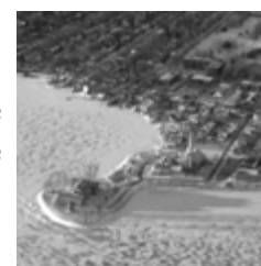
Le vieux village de Pointe-Claire