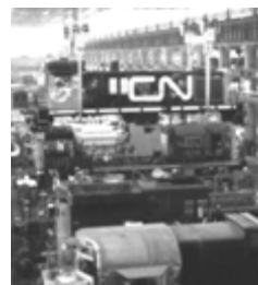
Les ateliers du CN à Pointe-Saint-Charles